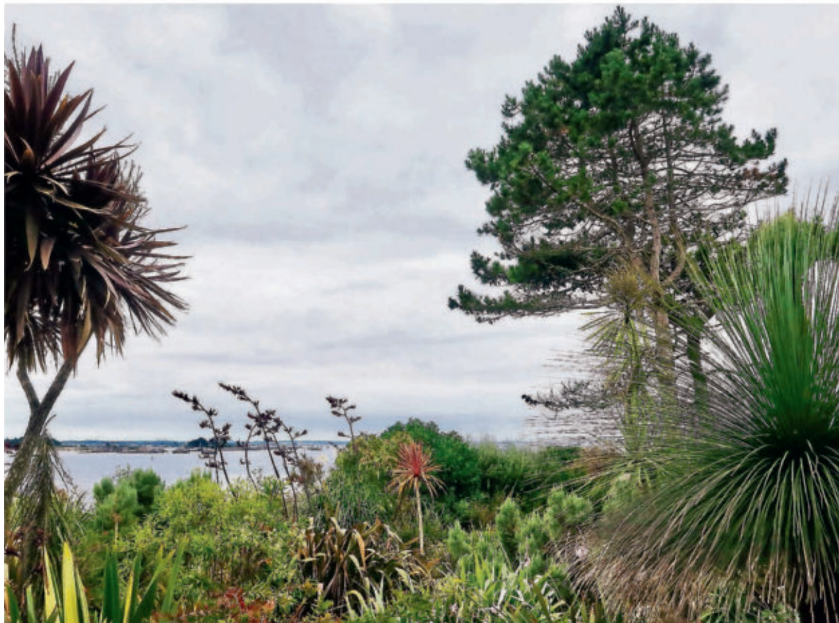
Eine subtropische Oase auf einer Insel mitten im Atlantik: Im Jardin Georges Delaselle stehen meterhohe Palmen und Bananenstauden.