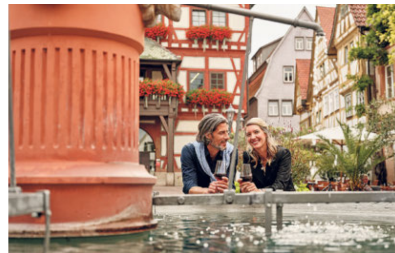
Das Weinland Baden-Württemberg bietet zahlreiche Wein-Events für Weinprofis und Weinfans. Idyllische Weinbergkulissen untermalen jedes Event auf einzigartige Weise.

Die Jungwinzerinnen und Jungwinzer der Vereinigungen „Generation Pinot“ aus Baden und „Wein.im.Puls“ aus Württemberg haben sich zusammengeschlossen, um Feste inmitten der Weinberge zu organisieren: die Weinsüden Pop-ups. Sie stehen unter dem Motto „Sommer, Sonne, Wein und Reben“ für eine Reihe von Events unter freiem Himmel und an wech-